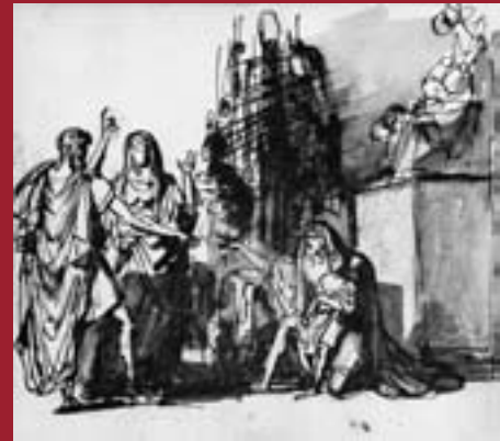
Annibale giovinetto giura odio eterno ai Romani (disegno adespoto, ca. 1770)