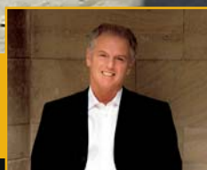
Orchestra Rai: l'atteso ritorno di Daniel Barenboim