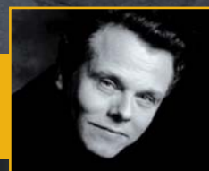
Mariss Jansons con la Bayerischer Rundfunk al Lingotto