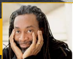
Bobby McFerrin all'Unione Musicale: la voce prima di tutto

Poste italiane - Spedizione in A.P. - Art. 2 comma 20/c - r.a. n. 662/96/D.C. - D.C.I. Torino - Anno IX numero 5/2007 - maggio 2007 - Stagione 2006-2007 - numero 9 - Taxe percue - Tariffa riscossa - C.R.P. Torino C.M.P. Nord